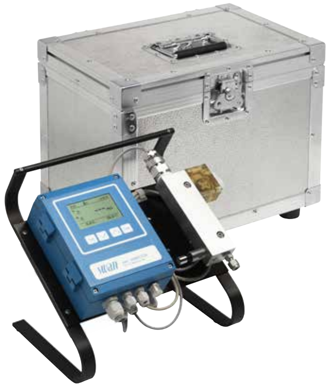
AMI INSPECTOR Datenblatt Nr.: siehe Rückseite