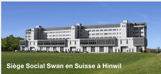
Siège Social Swan en Suisse à Hinwil

Swan Wasseranalytik AG Studbachstrasse 13 CH-8340 Hinwil Téléphone +41 44 943 62 62 wasseranalytik@swan.ch https://wasseranalytik.swan.ch