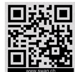
Monitor AMI Oxytrace QED Scheda Tecnica nr. DitA2245XX00