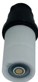
Sensore Oxytrace G No.: A87213010